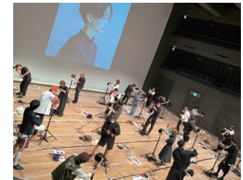
宇都宮市文化会館で行われた2023コンテストの様子

AVANZARE では毎年グループ全店舗が集結して技術コンテストが行われています。技術力やセンスをそれぞれのテーマで競い合います。今回 THE PAPER の表紙を飾っている3作品はいずれも 2023 年フォトコンテストで選ばれた優秀作品です。14 回目を迎えるコンテスト、今年は10月に水戸市民会館で開催される予定です。