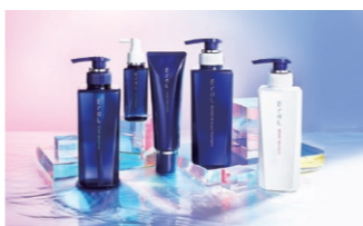
Eril 最高峰のエイジングケアアイテム

グループのプライベートブランド「ルチカネオ」のシャンプー・トリートメントはイーラルの研究所を同じくするグループ会社、日華化学様と共同開発した商品です。